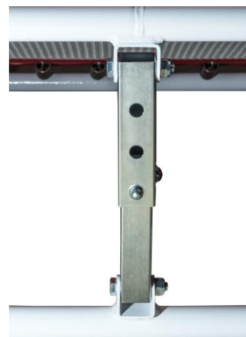
Pie ajustable en altura