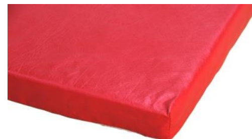
Sans coins renforcés