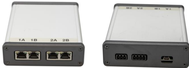
Boîtiers USB 1 et 2