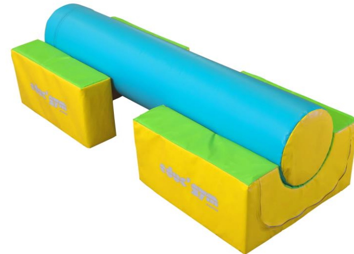
Réf. 0334 + Réf. 0329