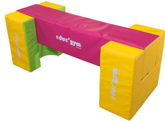
Réf. 0334 + Réf. 0330