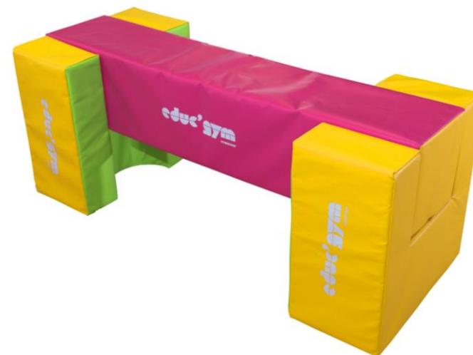
Ref. 0334 + Ref. 0330