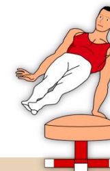
Apprentissage du cercle jambe serrées