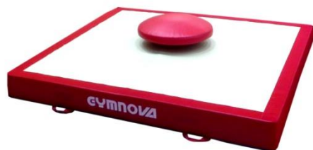
Réf. 1399 + 3581

Réf. 1399 : Tapis spécifique pour champignon réf. 3581 200 x 200 x 20 cm (Lxlxép.)