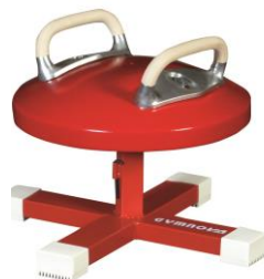
Réf. 3581 + 3584