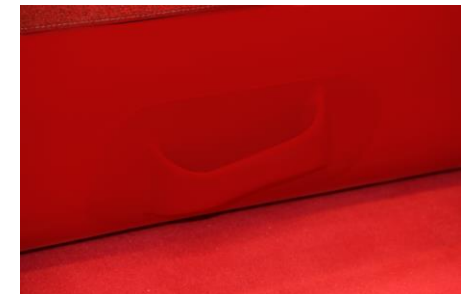
Asas de transporte