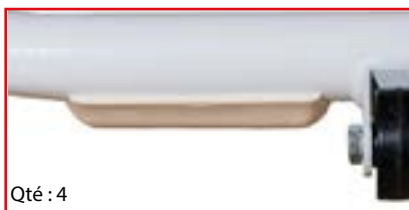
Patins de mini-trampoline