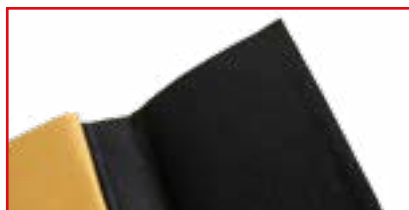
Non tissé adhésif - L : 3 m - l : 25 cm