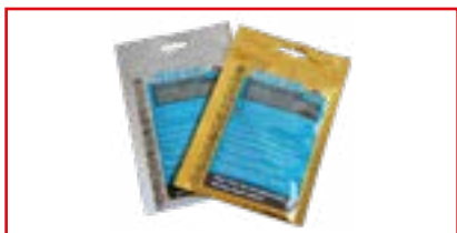
Kit de réparation

«Type A» pour matériaux divers (hors PVC) avec pièce adhésive. Dim. : 7,6 x 30 cm