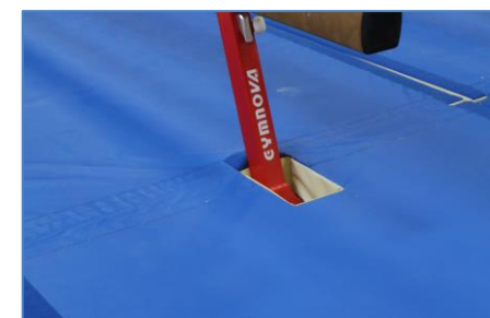
Recorte para las patas (refs. 394, 395, 396 y 397)