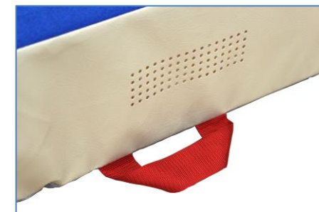
Asas de transporte y rejilla de descompresión