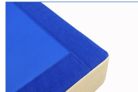
Sistema de unión a ambos lados