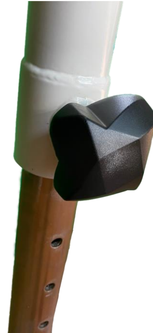
El ajuste de altura se realiza muy fácilmente