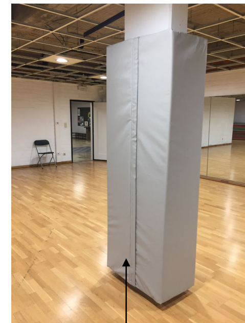
Cierre mediante bandas de unión

Consúltenos para cualquier solicitud específica