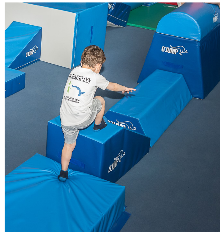
Réalisez des circuits pédagogiques