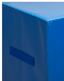
Poignée de portage