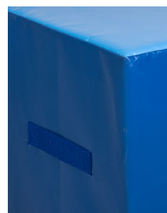
Asa de transporte