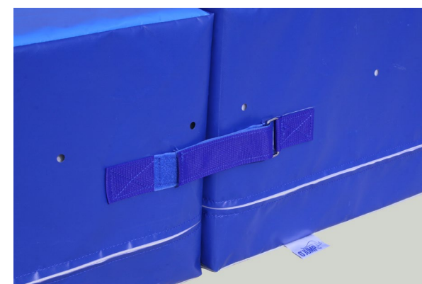
Correas de acople