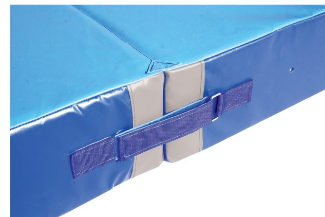
Correas de sujeción