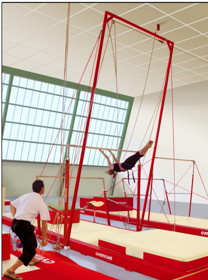
Pórtico de ayuda para entrenamiento en barras asimétricas