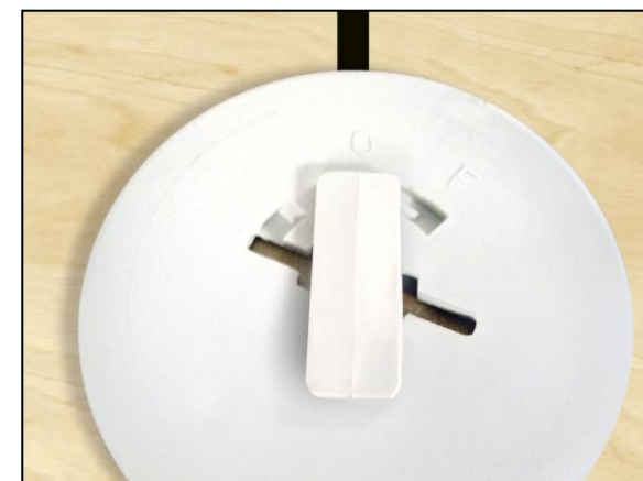
Placa de unión con cerrojo