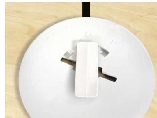
Plaquette de liaison verrouillable