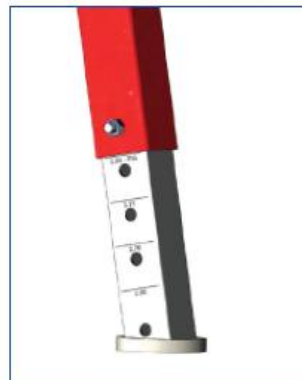
Pieds réglables en hauteur