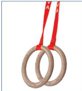
Anneaux en bois multiplis