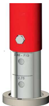
Réglage en hauteur des pieds