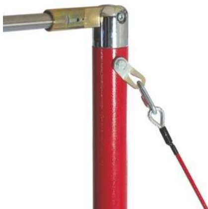
Tête pivotante en acier