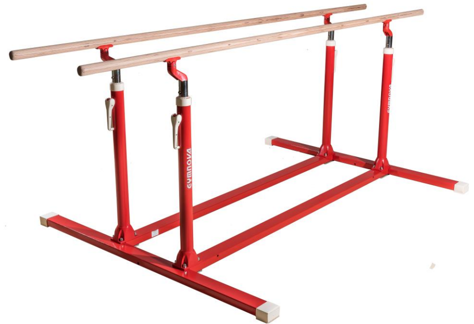
Ref. 3920 : barras paralelas con pies fijos