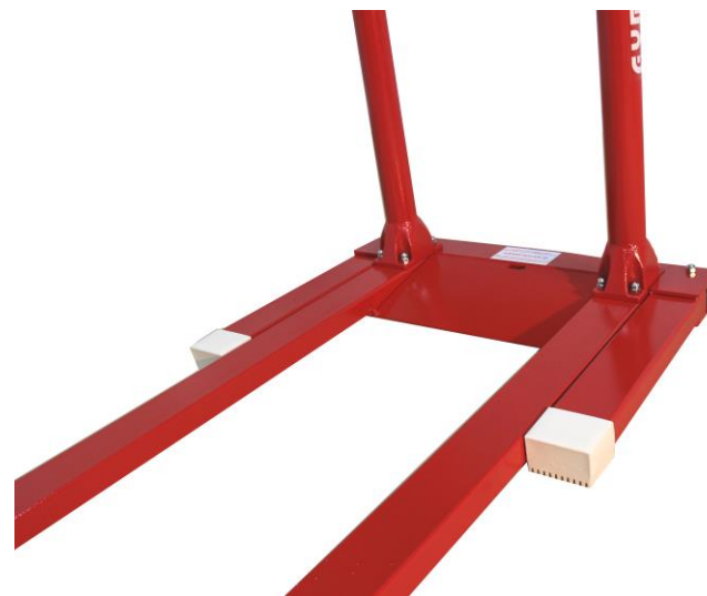
Ref. 3910: barras paralelas con pies plegables y caretillas de transporte