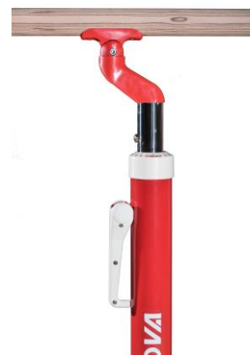
Cuello del cisne