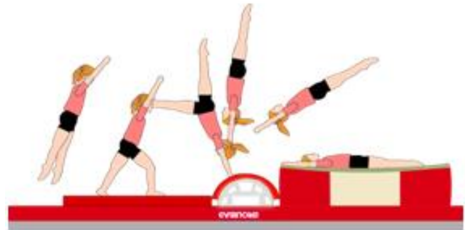
Travail du deuxième envoi de la lune