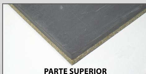
PARTE SUPERIOR Espuma de polietileno

* Parte superior => 3 cm de espuma de polietileno