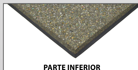
PARTE INFERIOR Espuma aglomerada de poliuretano